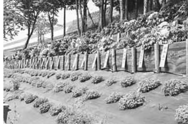
美しく整備された 高速のり面花壇