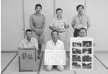
表彰式に参加された皆様で 喜びの一枚☆

大崎市で初・宮城県でも3例目という非常に名誉ある表彰です。下宿区民の皆様、おめでとうございます！