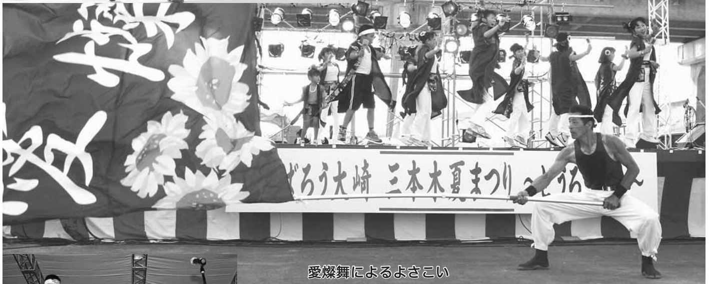
愛燦舞によるよさこい