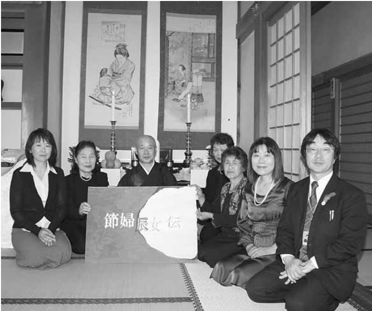
天性寺住職(中央)、新三本木総合支所長(右端)と虹の会のみなさん