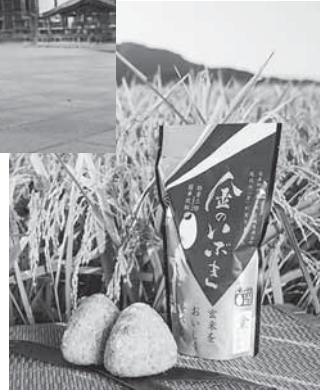
JA新みやぎで取り扱っている金のいぶきパッケージと ▶