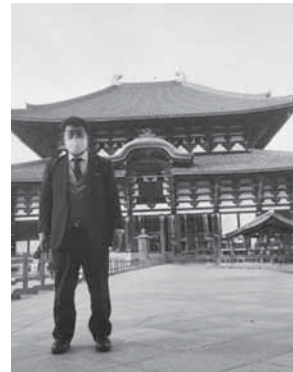
◀東大寺に金のいぶきを献米した際の写真

また、玄米は炊くのが難しいという声を良く聞きますが、「金のいぶき」は自宅にある炊飯器の種類にもよりますが、白米モードや通常の炊き方で簡単に炊く事が出来、金のいぶきだけでも美味しく食べられますがオススメの炊き方としては、白米2：金のいぶき1の黄金比率で混ぜ、塩をひとつまみ入れて炊くともっと美味しく食べる事が出来ます。これを機に皆さん一度「金のいぶき」を手にとって実際に食べてみて下さい！！