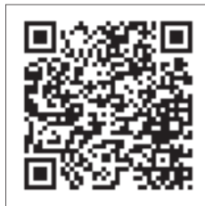
まちづくり協議会QRコード

②友達登録の完了後、メッセージが送信されますので、トーク画面からご意見の内容を書込み、送信してください。