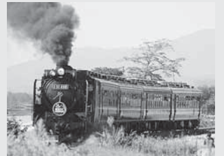
▲東北DC・陸羽東線号

9月いっぱい東北デスティネーションキャンペーン(東北DC)が終わりました。過去のDCと比べて盛り上がりには欠けたように思います。これもコロナ禍の為にイベントが中止・縮小にせざるを得なかったので仕方がなく残念でした。その中で8年ぶりに陸羽東線にSLが運行