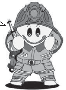
大崎消防マスコットキャラクター「らいすくん」

確認しても音が鳴らない場合は、電池切れや本体の故障などが考えられますので、速やかに電池や本体を交換しましょう。