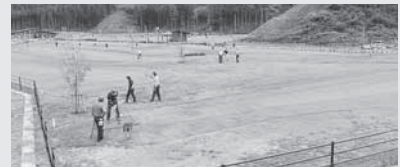
▲改修オープンのひまわりコース

三本木パークゴルフ場ひまわりコースの改修が終了しオープンしました。大変きれいに仕上がっていました。残りの2コースも順次工事に入るそうで、期待して待ちたいと思います。