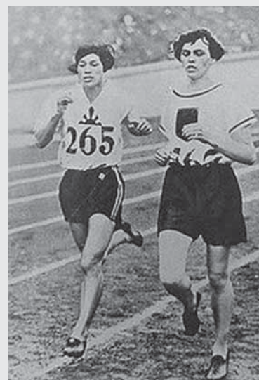
▲左：人見絹枝さん 陸上800で銀メダル アムステルダム五輪 (23023004762)の写真より