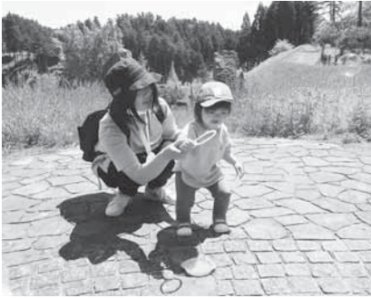
「ママ、しゃぼん玉とばすよ〜!」