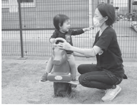
「ママ、ゆらゆらして楽しいね」