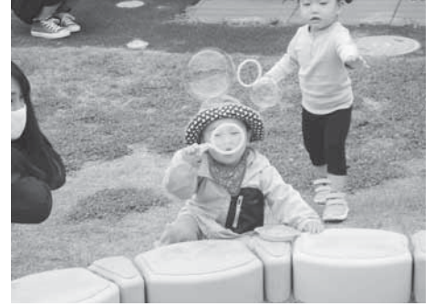
「フ〜!どこまで飛ぶかな」