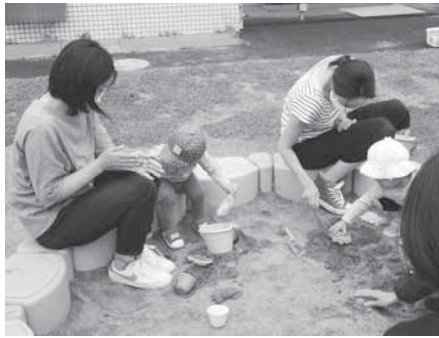
「砂で何をしようかな?」