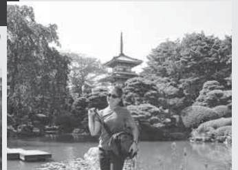
▲仙台で観光。七夕の時