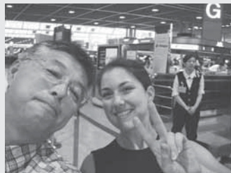
▲成田空港まで見送りに行きました