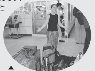
▲帰国の時 大量の荷物とともに成田空港へ