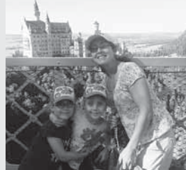
◀ママになって双子の娘と現在ドイツにいます