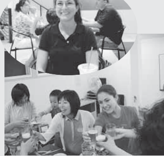
▲英会話クラブに参加