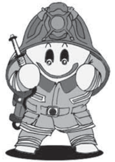
大崎消防マスコットキャラクター「らいすくん」