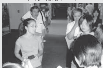
▲2006年8月の訪問団とアトランタで②