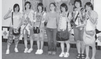
▲2006年8月の訪問団とアトランタで①