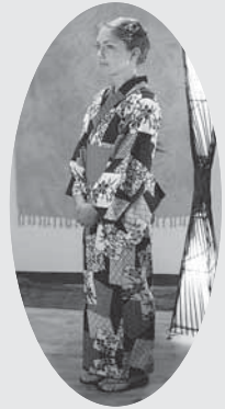
◀古川祭りで着物をきてみました