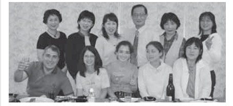
▲ご両親と妹さんが来日しました