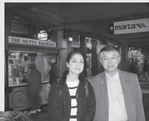
▲2006年3月国際交流協会の訪問の時アトランタで