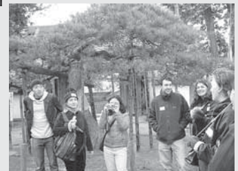
▲ALTたちと平泉に行きました