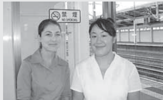
▲前任のアケミさんを古川駅でお見送り