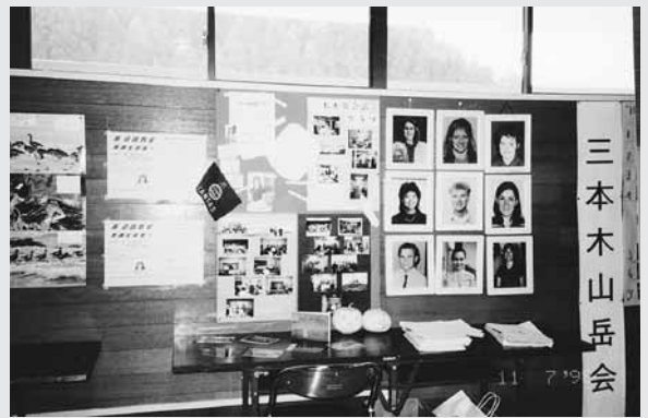
のちの英会話クラブの文化祭でのディスプレイ