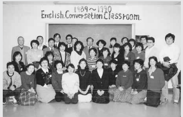
三本木で初めての英会話教室の参加者