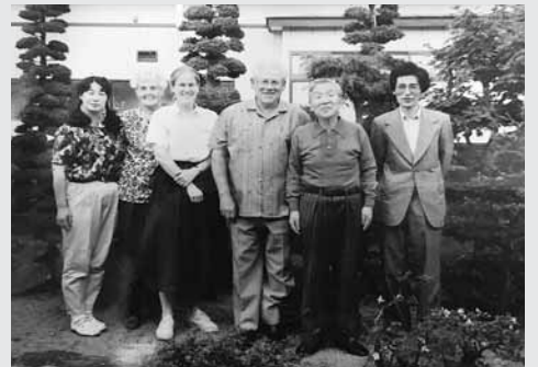
来日したエリザベスのご両親と

それから二年ぐらいて、ご両親を連れて日本を観光し、そのコースに我が家も訪れ自分の勤務先だった中学校を訪問し、娘の説明にうれしそうになさぐご両親でした。我が家の家族にとっても沢山の体験をさせていただくいい機会でした。二年間でバス先生は日本語をしゃべれるようになり、会話もだいたいスムーズになったのに私は進歩しませんでした。英単語を並べて話したことで通じ合えた時はうれしさを味わえました。バス先生は他国に来て必要に迫られれば覚えられるけれど、日本にいて英語で話せるようになることは難しいと励ましてくれました。バス先生、楽しい思い出をありがとうございました。今は、どうしていることでしょうか。時々あの頃のアルバムを見て懐かしく思い出されます。