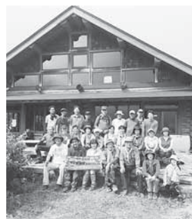
昨年の区民登山参加者

今年の三本木区民登山は、奥羽山脈を越え加美町漆沢と山形県尾花沢市銀山温泉を結ぶ古道『最上街道 軽井沢越え』です。現在の国道347号線が開通する明治25年まで、地域の政治・経済・文化に大きな役割を果たしてきた海道です。途中、役所・神社・宿場跡などの基礎石や石段、銀山跡などの歴史を感じることができる史跡も多く、船形連峰や栗駒山、葉山、月山などを見ながら沼や滝など自然の景観も楽しむことができます。