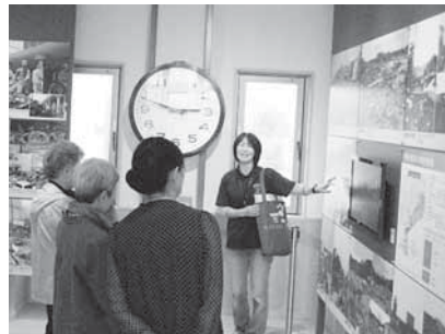
▲取り壊しとなった小学校に設置されていた時計。地震が発生した時刻で止まっている