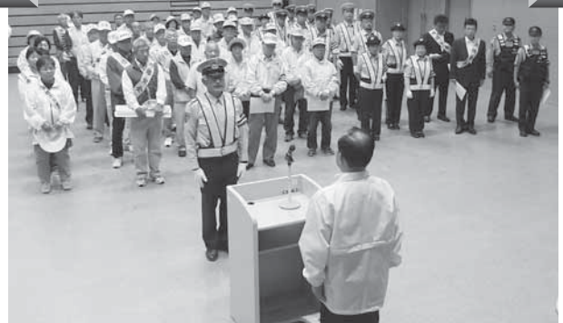
秋の交通安全運動 三本木での出動式の様子