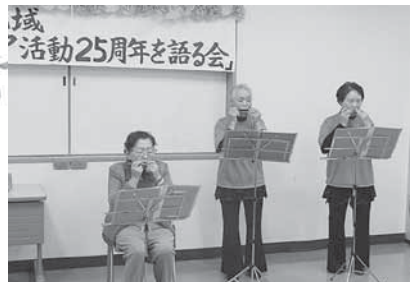
日頃病院、施設などへの慰問活動をしている「ひまわりハーモニカ」から3名が演奏しました。

ボランティア友の会の前身である「ほのぼの会」は平成4年10月にボランティア活動に興味のある人たちが集まり発足しました。発足当初の会員数は62名で、ボランティアについて研修会を開きながら、運転ボランティア・ウィークサービス・ひまわり会への手伝い等をしていました。