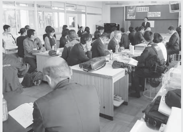
講義前のボランティア講師のみなさん