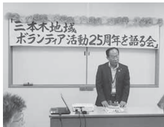
来賓市長代理の太田支所長