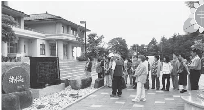
▲現在、公民館として使用されている旧戸倉中学校

戸倉中学校は南三陸町南部の戸倉地区の高台にあった中学校です。東日本大震災では、津波に襲われる間際までグラウンドに避難していたため、複数の生徒・教諭が津波にのみ込まれました。助かった人もいましたが、1年生の男子生徒と教諭の2名が犠牲となりました。生徒数が減少することが予想されるため、2014年4月より志津川中学校に併合され現在中学校の建物は、公民館として使用されています。