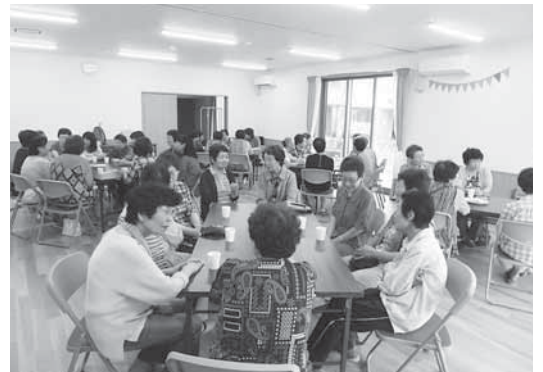
▲災害公営住宅に暮らす方々との交流会の様子

戸倉中学校は南三陸町南部の戸倉地区の高台にあった中学校です。東日本大震災では、津波に襲われる間際までグラウンドに避難していたため、複数の生徒・教諭が津波にのみ込まれました。助かった人もいましたが、1年生の男子生徒と教諭の2名が犠牲となりました。生徒数が減少することが予想されるため、2014年4月より志津川中学校に併合され現在中学校の建物は、公民館として使用されています。