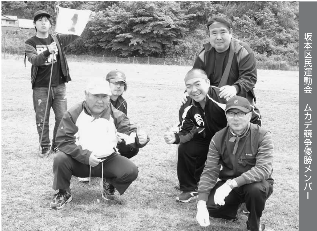
坂本区民運動会 ムカデ競争優勝メンバー