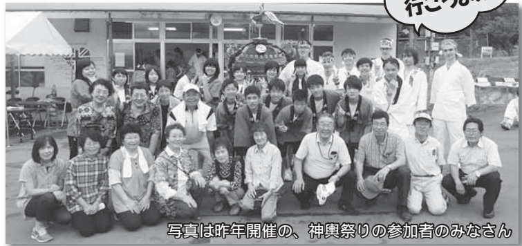
写真は昨年開催の、神輿祭りの参加者のみなさん