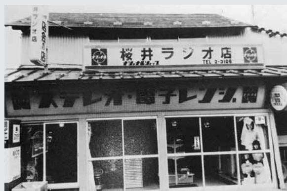
今は無き「桜井ラジオ店」