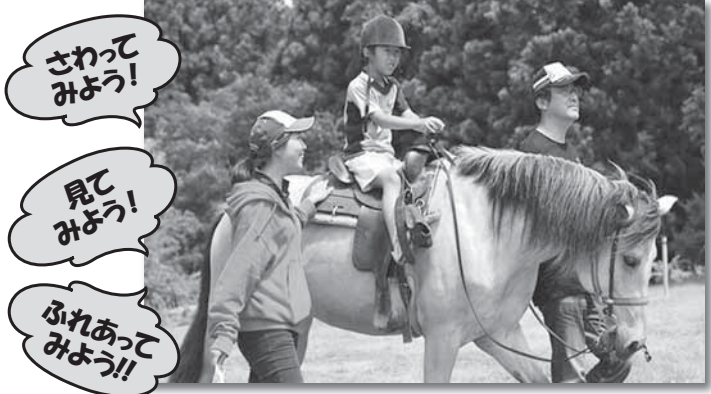
青森から十和田乗馬倶楽部の馬がやってくるよ!!

会場 大崎市三本木新沼字坪呂33-2 三本木いぐねの里 問い合わせ ☎0225-22-4804