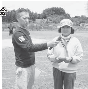
▲〇×クイズの出題者と優勝者

6月4日(日)坂本グランドにて、約200名が参加し、区民運動会が開催されました。メイン競技の百足競争では、第3班が1位となり、続いての〇×クイズでは、青年会長が前日まで考え抜いた難問に脱落者が続出。優勝者には7月に発売される「大崎市プレミアム商品券」の目録が渡されました。