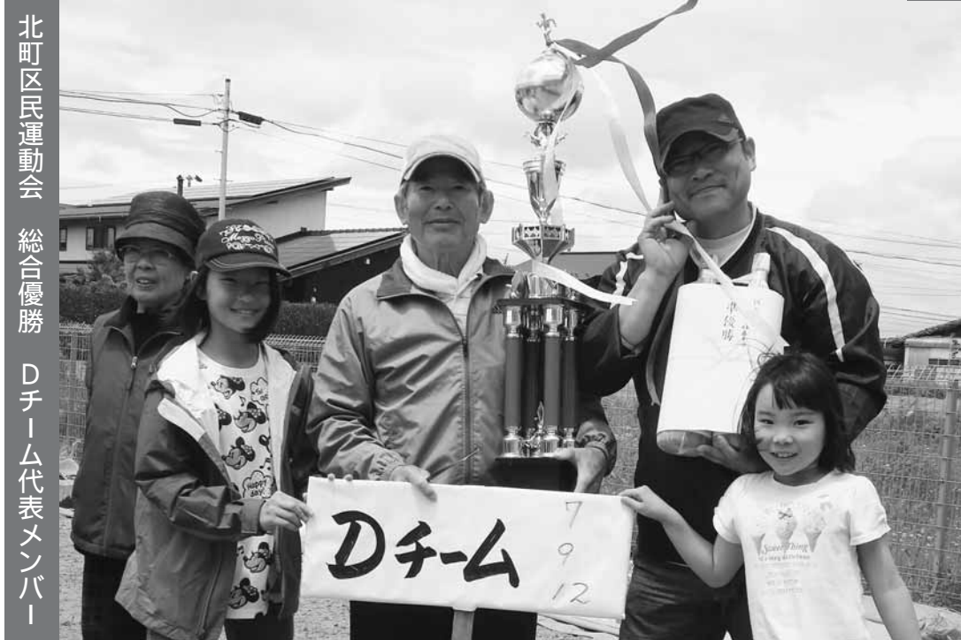
北町区民運動会 総合優勝 Dチーム代表メンバー