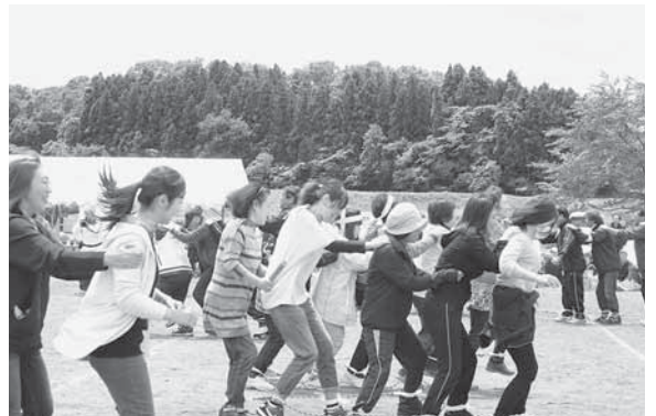
▲チームワークがキメテ?百足競争