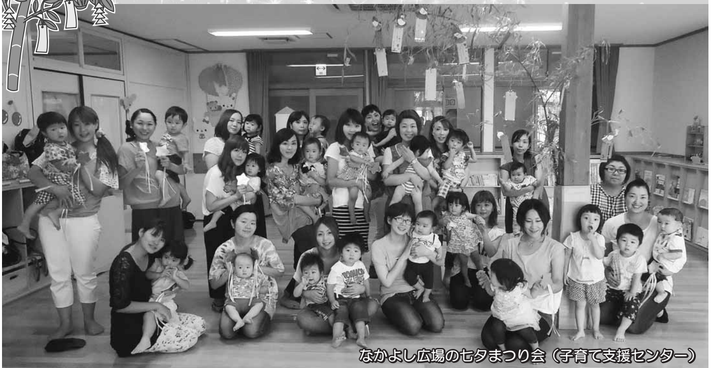
なかよし広場の七夕まつり会 (子育て支援センター)

7月7日(火)、ひまわり園では、いきいきクラブの皆さんを招待しての『七夕会』が開かれました。1～2歳児の作ったプレゼントをもらったおばあさん達は、とてもうれしそうでした。